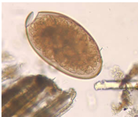
شکل ۴- تخم فاسیولا

در موقع دفع نارس می‌باشند، فقط در صورت رسیدن به آب تکامل می‌یابند (شکل ۴).