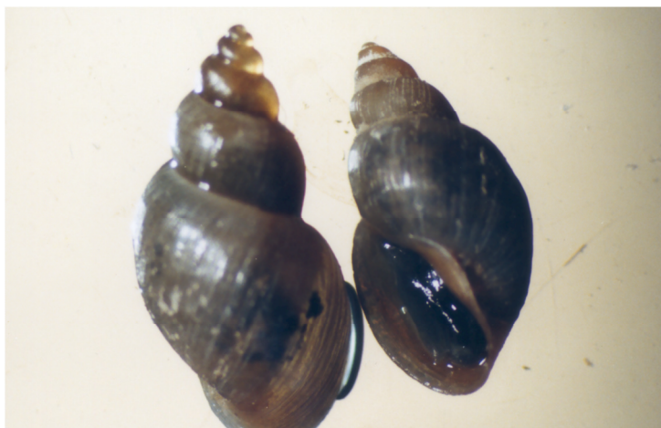
شکل ۳- لیمنه ترونکاتولا ناقل فاسیولاهپاتیکا

انواع حلزون‌های جنس لیمنه ناقلین مهم انگل‌های فاسیولاهستند. حساسیت حلزون‌های مختلف جنس لیمنه به انگل‌های فاسیولای موجود در ایران به وسیله محققین متعددی مورد بررسی قرار گرفته است. اگرچه این تحقیقات با نتایج متفاوتی همراه بوده است، ولی دیدگاه غالب بیانگر این است که حلزون لیمنه ژدروزیانا ( Lymnaea gedrosiana ) ناقل فاسیولاژیگانیتیکا و حلزون لیمنه ترونکاتولا ( Lymnaea truncatula ) ناقل فاسیولاهپاتیکا می‌باشد.